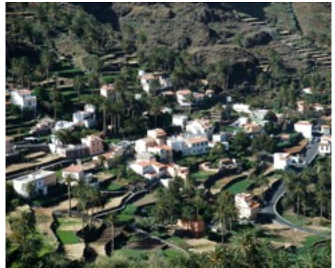
La Gomera 2010

'Het echte probleem is hoe tot volledige, onvoorwaardelijke aanvaarding van het feit te komen dat 'jij' nooit degene bent die doet, maar dat wat gedaan wordt slechts een gebeurtenis is. Het antwoord op dit vraagstuk, is in de praktische en persoonlijke ervaring te vinden. Alles wat gedaan wordt en waarvan jij denkt dat jij het bent die doet, gebeurt niet dankzij maar ondanks jou! Dat weet je wel, want je hebt nimmer kunnen krijgen wat je wilde hebben. Wat er gebeurt, is nooit binnen jouw controle. Dat is iets dat je uit praktische en persoonlijke ervaring weet. Wanneer voel je eens niet de last van verantwoordelijk te zijn voor je handelingen met al zijn gevolgen? Dat is alleen aan de orde als je er volledig van overtuigd bent dat jij die niet gedaan hebt. Jij bent nooit degene die het doet, maar niet alleen jij, niemand handelt ooit. Geen enkel mens handelt.' Uit: 'Het ego doorzien', Ramesh S. Balsekar